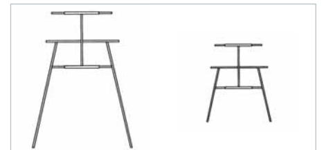
APOYO INTERMEDIO INTERMEDIATE SUPPORT