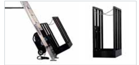
JAULA ESPECIAL SPECIAL CAGE (480 mm. x 1.200 mm. x 1.100 mm.)