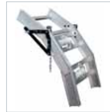
TRAMO ARTICULADO ARTICULATED SECTION