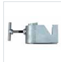
FIJACIÓN ANDAMIO SCAFFOLDING CLAMP