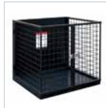
JAULA ESTÁNDAR STANDARD CAGE (600 mm. x 780 mm. x 690 mm.)