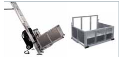
JAULA ALUMINIO ALUMINIUM CAGE (900 mm. x 1.600 mm. x 830 mm.)