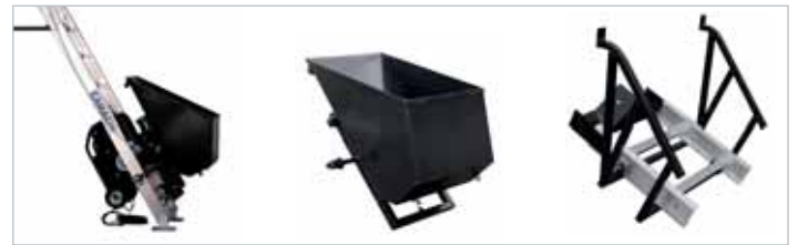
CONTENEDOR AUTOMÁTICO (70 l.) AUTOMATIC CONTAINER (70 l.)