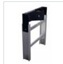
TRAMO FINAL FINAL SECTION