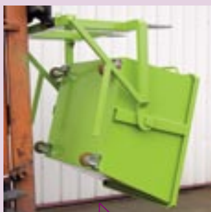
Vaciado con viga de suspensión PL independiente